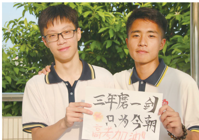
学子相互鼓励, 迎战高考。